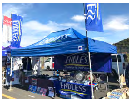
エンドレスアドバンス