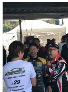
写真右がモリゾー選手(豊田章男社長)

S耐第6戦岡山のST-4クラスは今回、T'sコンセプト小倉クラッチ86のCドライバーとしてモリゾー選手(豊田章男トヨタ自動車社長)が参戦し、話題となりました。モリゾー選手のご子息である豊田大輔選手(写真中央)は、同チームのドライバーとして鈴鹿、SUGO、富士、岡山に参戦しています。