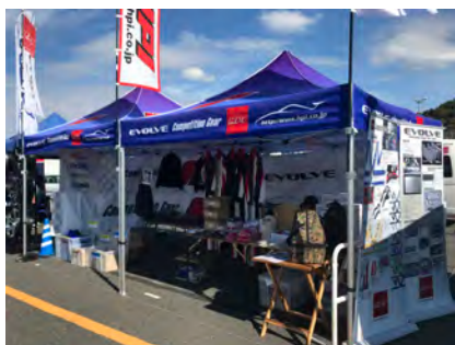
エイチ・ピー・アイ

当振興会では来期もスーパー耐久シリーズへのNAPAC会員出展を後押しして参ります。よろしくお願い致します。