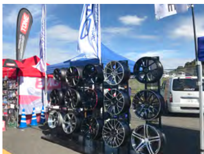
レ イ ズ