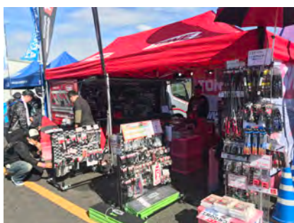
T O N E