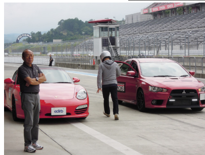
● プロドライバーによる同乗走行を楽しみに本走行会に参加されるドライバーは少なくありません