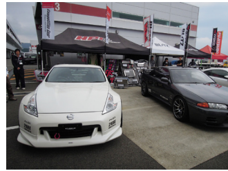
エイチ・ビー・アイ