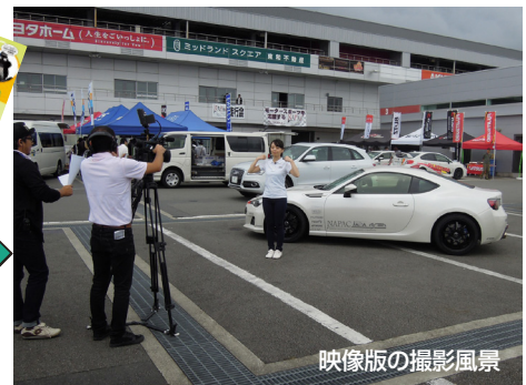
映像版の撮影風景

映像版では、ライティングからエンジンパーツまで 8 つの代表的なスポーティングパーツを取り上げ、ノーマルパーツとの違いや ASEA 基