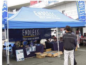
エンドレスアドバンス