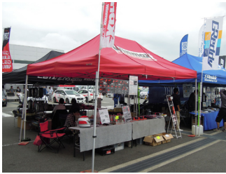
エムケーカシヤマ