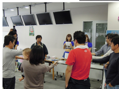
● 走行会終了後は豪華景品が当たる大抽選会で盛り上がりました。ご協賛頂いた会員各位に改めて御礼申し上げます