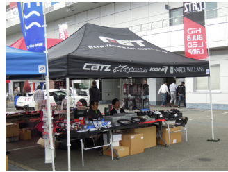
アサヒライズ FET 事業部