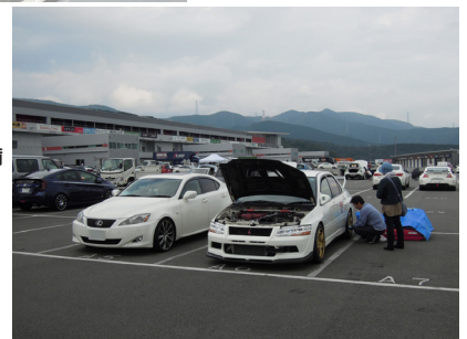
● 走行会参加前の車両準備風景